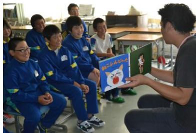
「6年生も、話術に引き込まれ…」

読書ボランティアの皆さんありがとうございました。どの教室でも、子どもたちは目を輝かせ、時には喚声をあげながらボランティアさんの朗読に聞き入っていました。ありがとうございました。