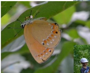
「羽を休めるチョウ」