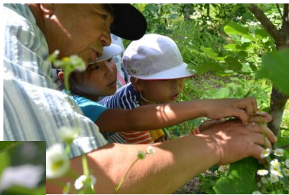
「ここに卵があるよ…」

観察会後のアンケートには「チョウセンアカシジミの羽の色がきれいなのがすごいと思った。」「たまごをいっぱい見られたり、チョウセンアカシジミをいっぱい見られたりして楽しかった。」など記述していました。