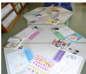
「いろいろな紹介文」

また、図書委員おすすめの本が図書室に展示されています。子どもたちが工夫した紹介文は、どの本も手にとって読んでみたくなるような内容でした。