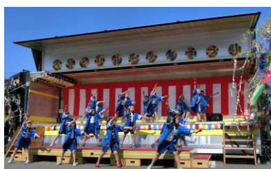
「気持ちを込めて踊りました」

7月8日(出)、うねとり荘夏祭りに4年生が参加し、よさこいソーランを披露してきました。夏の暑い日差しの中、アンコールにも応え、精一杯の踊りを披露しました。