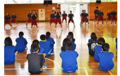
「体育館への入場」と「中学生の応援」