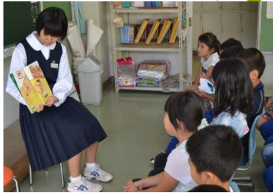
「教室での読み聞かせ」

普代中の図書委員のお兄さんお姉さんが、読み聞かせに来てくださいました。中学生ならではの本の親しみやすさ、語り口など、小学生の子ども達をよく引きつけた読み聞かせでした。