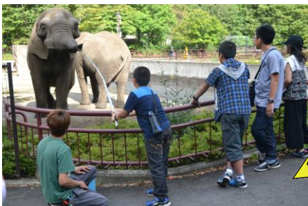
「ゾウへのエサやり体験」