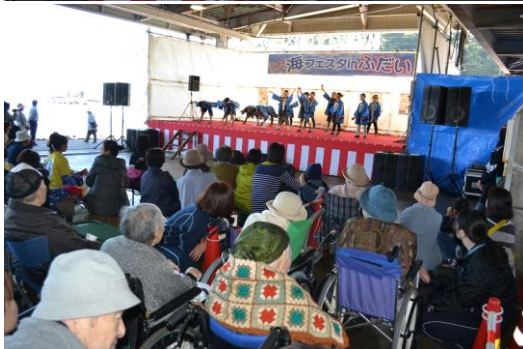
「会場で踊る3年生たち」