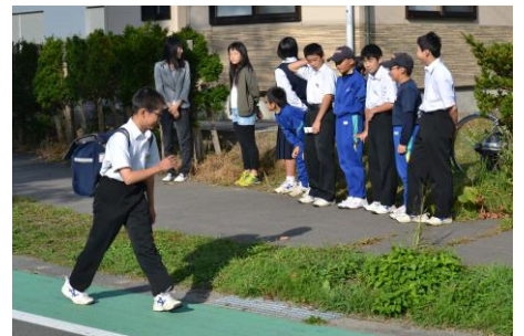
「27日・緑組2班 教員住宅前」