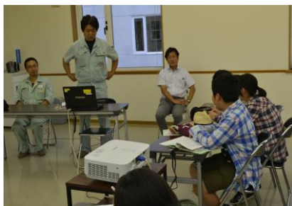
「東北シャノンさん たくさん質問に答えていただきました。」