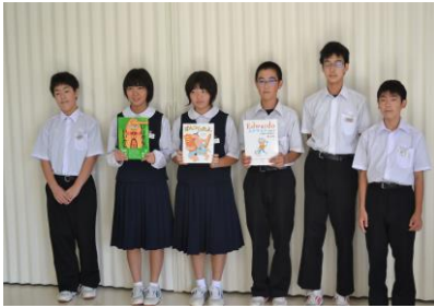
「読み聞かせ・中学生のみなさん」