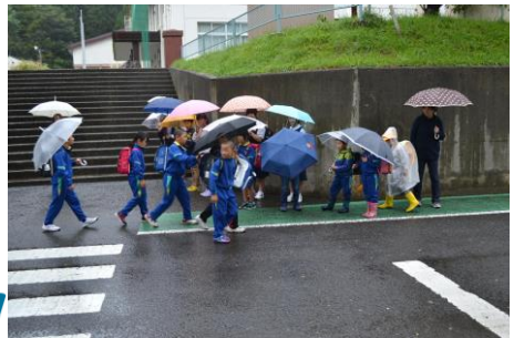
「28日・赤組1班 中学校前」