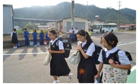
「26日・黄組1班 旧屯所前」

9月25～28日、第2回目のあいさつ運動が行われました。特に最終日は雨の中、それでも一生懸命「おはようございます」の声を掛けあいさつを呼びかけました。