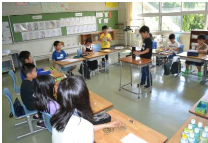
「3年生・作品発表会」

んだ自由研究や工作の発表をしたりしました。作品の説明や工夫したところを発表した他、遊