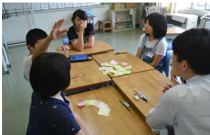
「6年生・夏休みの感想交流」