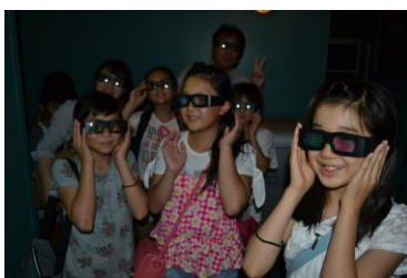
「USJ(ユニバーサル スタジオ ジャパン)にて」