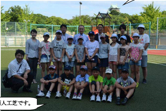
「追手門学院小学校で記念撮影」