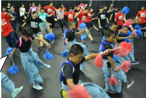
「高校生ダンスサークルと神楽を演舞」

ぜひ神楽を踊ってみたい…との希望で、追手門学院の高校生と一緒に神楽を舞いました。