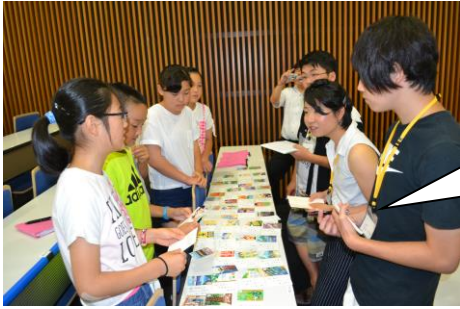
「大学生と『ふだいカルタ』で交流」

大学生との交流の場面。平成21年に作成された「ふだい夢カルタ」を使って普代村の紹介をしました。