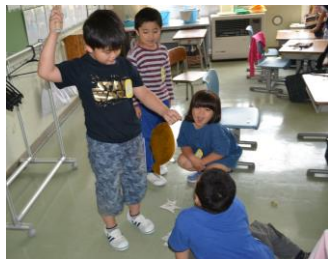
「1年生・人気の魚釣りゲーム」

ます。時間をかけて取り組んだ作品、家族からアドバイスをもらいながら良い作品を目指したもの、力作がそろいました。この機会にご来校のうえ