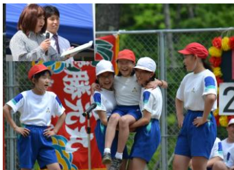
「早朝作業」「5・6年生チャンスレース」