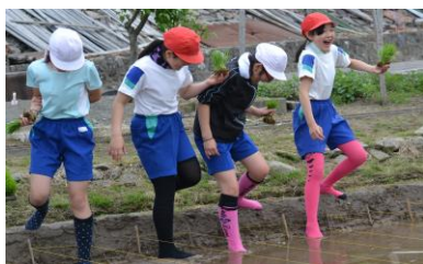
「泥の感触に、思わず…」