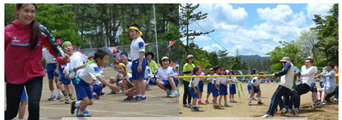
「全員リレー」 「PTA綱引き」

学年ごとの表現、ダンス、ソーラン、神楽も練習の成果を発揮し、見事に踊りきりました。また、保護者参加による全員リレー、綱引きなど、親子共々笑顔にあふれ、運動会を成功裏に終えることができました。