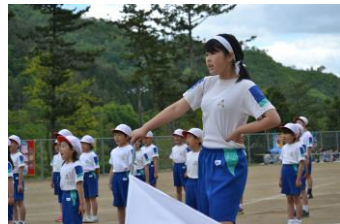
「赤白リーダーによる応援合戦」