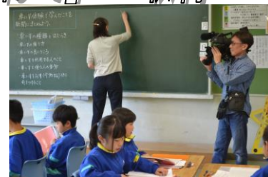
「4年 授業風景の撮影」

BS-TBS「校歌を訪ねて」という番組から、取材の申し入れがあり、6月6日(火)に収録が行われました。昨年、中学校でも同様に取材があったものです。全校児童の校歌斉唱や授業風景の撮影、児童へのインタビューなどがありました。普代小学校の校歌は昭和34年に制定されたもので、58年間、歌い継がれてきました。子ども達の日常生活とともに編集され放送で紹介されます。子ども達は緊張しながらも、明るく受け答えし、元気よく校歌を歌いました。編集が進み、放送予定(BS放送)が決まりましたならば、お知らせいたします。