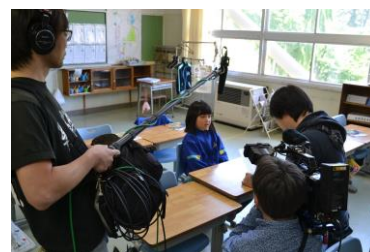
「教室でインタビュー」