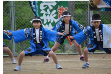
「3・4年:よさこいソーラン」