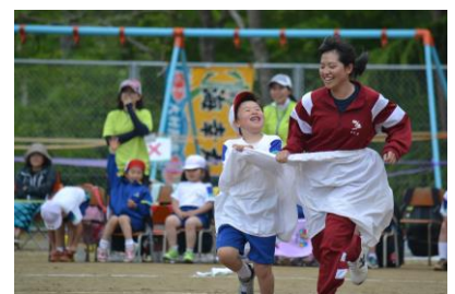
「中学生招待レース」

また、アトラクションとして中学生招待レースが行われました。中学生が身につけた「大きなパンツ」に小学校2年生を呼び入れ、リレーで競いました。その他、チャンスレースや道具の出し入れなど、色々な場面でお手伝いいただき、先輩である中学生のリードが頼もしく、よき手本を見せてくれました。