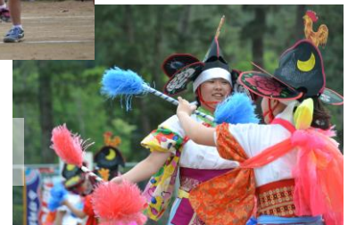
「5・6年:神楽 綾遊びの舞」

学年ごとの表現、ダンス、ソーラン、神楽も練習の成果を発揮し、見事に踊りきりました。また、保護者参加による全員リレー、綱引きなど、親子共々笑顔にあふれ、運動会を成功裏に終えることができました。