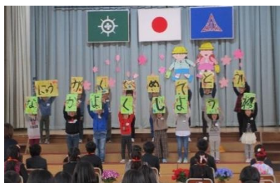
「2年生、歓迎のアトラクション」