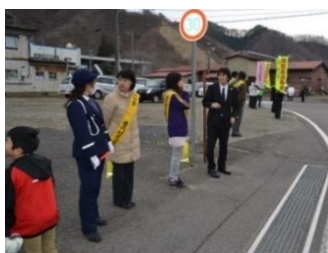
「保護者や地域の皆さんに見守られて…」

4月9日(月)から3日間、通学路で保護者や交通安全母の会の皆さん地域の皆さんのご協力で、交通安全の指導を行いました。