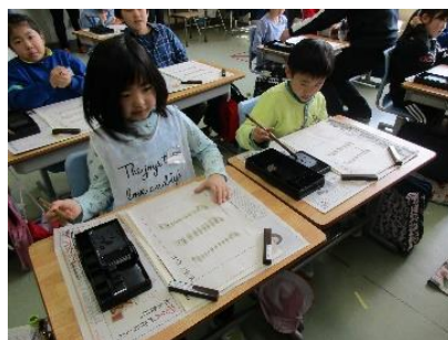
「3年生国語、はじめての書写」