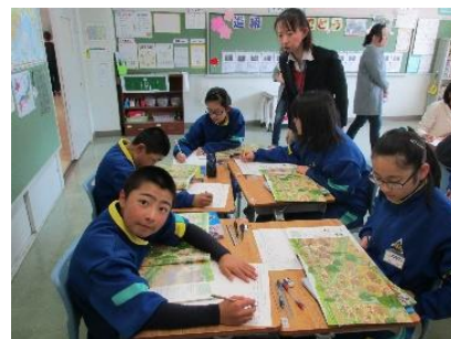
「6年生社会、縄文と弥生…」