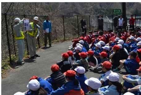
「三陸国道事務所の方から、ご説明いただきました。」