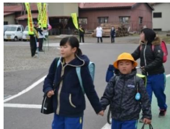
「上級生に手をひかれ…一緒だと安心ですね。」