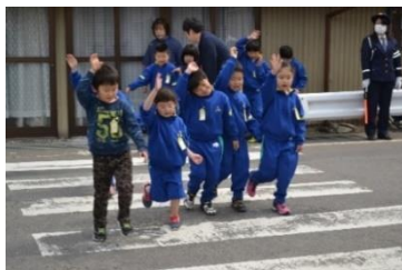
「1年生、歩行訓練をしています。」