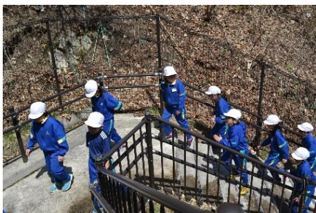
「階段は108段…、登りは、数える余裕がありません。」

年々、震災の経験が薄れていく中ではありますが、「災害から身を守る」ためにどのような行動をとればよいか…、訓練をきっかけに考えさせたいと思います。「もしも…」の時、災害時の避難行動について、ご家庭でも、話題としていただけたら…と考えます。