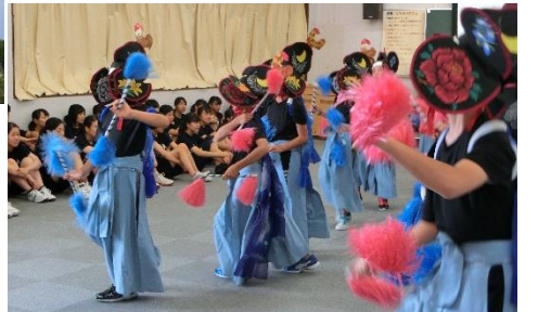
「高校生ダンス部と…」