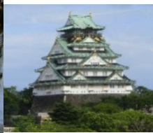
「小学校から望む…大阪城」