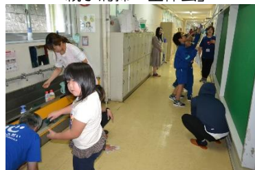
「低学年は、廊下そうじ」