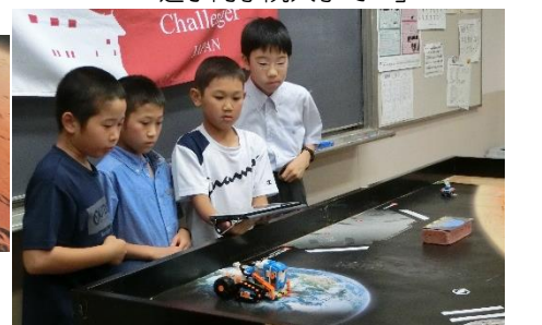
「中学校・科学クラブで…」