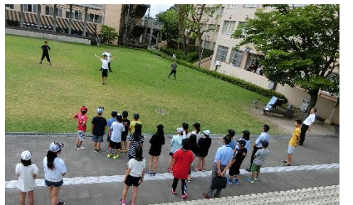
「追手門学院大学で…」