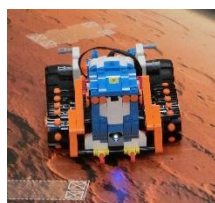
「プログラムしたロボット」