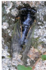
「大阪のセミ…クマゼミ？」