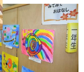
「1年生、みてみておはなし」