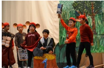
「1・2年『さるじぞう』 …三船のアイスキャンディをどうぞ」

5・6年生は「タピオカ・ツンドラ」、テストの点数勝負で対抗する男子女子が、次第に力を合わせ協力する大切さを学んでいく姿を、しっかり演じきりました。