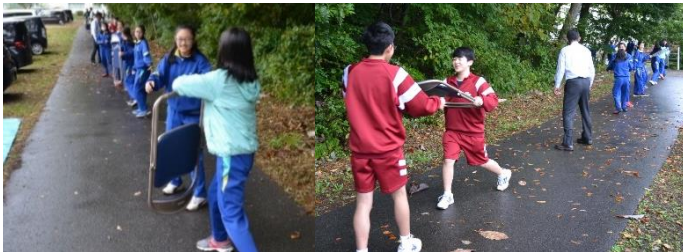
「この日、会場準備のためのいす運びも、小中一緒に行いました。」