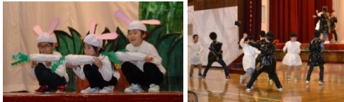
「うさぎさん登場」「ホワイト団・ブラック団の戦い」