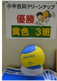
「優勝チームへの賞品」

内容は、小学生と中学生がチームを組んで、体育館の「ぞうきん掛けリレー競争」です。決められた距離を15人で往復して競争するという明快なルールでしたが、中学生の上手なリードと盛り上げる雰囲気づくりで、小学生も気持ちを高め夢中になって参加していました。全12チーム中、予選を勝ち抜いた6チームによる決勝を経て、「黄色3班」が見事優勝しました。