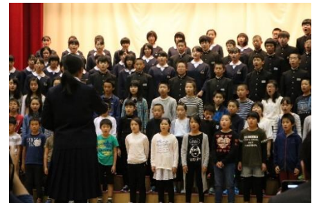
「小中合同合唱(4・5・6年、中学生)」