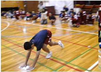
「中学生、勢いのあるダッシュ」