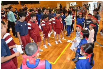
「リレーチーム、作戦会議」