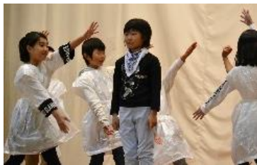
「3・4年『ねらわれたたましい』」