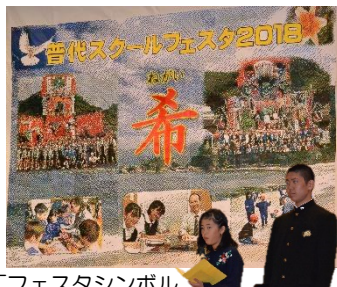
「フェスタシンボル、『児童会長・生徒会長あいさつ』」