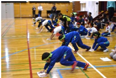
「ぞうきん掛けスタート」