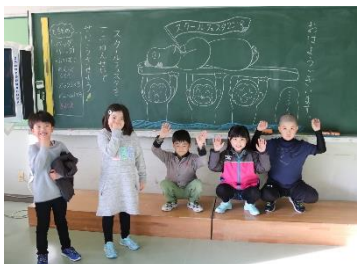
「フェスタ当日の朝、さあ、やるぞ！さるじょう！」