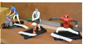
「6年生、十二年後の私」