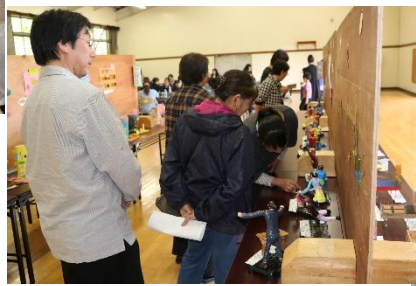
「格技場、展示見学の様子」