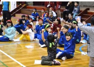
「予選通過！ハンザイ！」