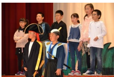
「5・6年、『タピオカ・ツンドラ』」